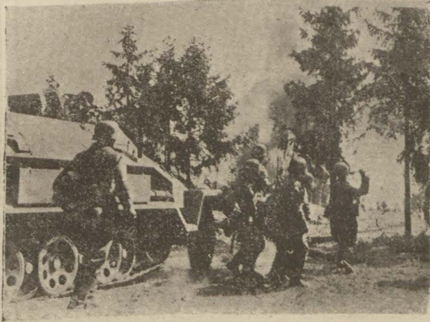
Alman askerleri bir meskûn mahalle taarruz esnasında