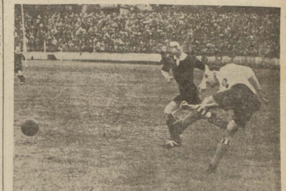
Admira takımı yaptığı maçlardan birinde

Kafileye riyaset eden Alman spor teşkilâtı reisi Türk sporunun ilerleyişini sonsuz bir memnuniyetle takib ettiğini söylüyor