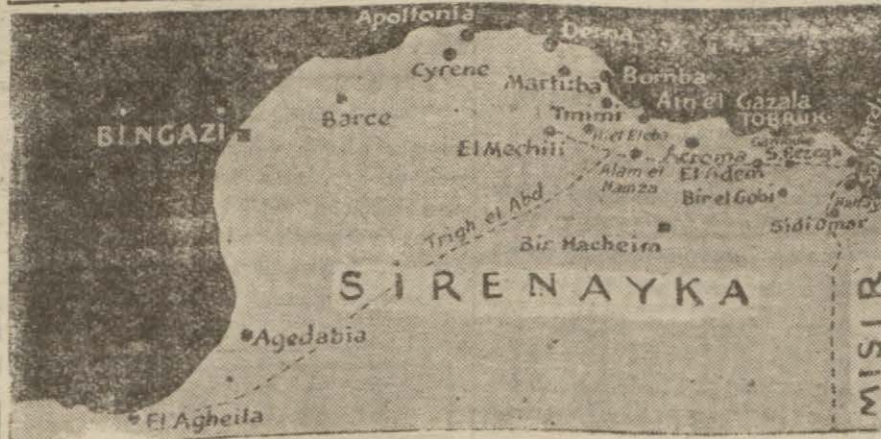
Mihver taarruzunun yapıldığı sahayı gösterir harita

Berlin 29 (A.A.) — Alman or- duları başkumandanlığının tebliği: Harkofun cenubunda muharebe sahasının mağlûb düşmanın dağı- nk bakiyelerinden temizlenmesi- ne devam edilmektedir. Esir ve ganimet miktarı durmadan art- maktadır. Şark cephesinin merkez kes- minde bir taarruz teşebbüsü an- dane muharebelerden sonra birkaç (Devamı 5 inci sayfada)